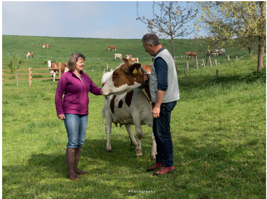
Im Projekt werden Landwirt/-innen zu ihren Einzeltieren und der gesamten Herde komplementärmedizinisch beraten.

Antibiotika sind Medikamente, die sowohl in der Human- als auch in der Veterinärmedizin für die Behandlung von bakteriellen Erkrankungen verwendet werden. Antibiotika töten Bakterien ab oder hemmen deren Wachstum. Bakterien können sich jedoch anpassen und so unempfindlich gegenüber Antibiotika werden (Resistenzbildung). Wenn nun solche Bakterien eine Infektion verursachen, ist diese nur noch schwierig oder gar nicht mehr zu behandeln. Antibiotikaresistenzen sind ein globales Problem und bedrohen die öffentliche Gesundheit. Deshalb gilt es, Mittel und Wege zu finden, den Einsatz von Antibiotika zu reduzieren. In der Schweizer Nutztierhaltung wurden im Jahr 2013 (Stand Projektplanung) 52 250 kg Antibiotika eingesetzt. Obwohl der Antibiotikaeinsatz mengenmässig zurückgeht, nehmen Resistenzen tendenziell zu. Die Frage, wieviel Antibiotikum nötig ist, um die Gesundheit der Nutztiere sicherzustellen, ist umstritten. Deshalb wurde 2012 ein Beratungsnetzwerk und 2015 der Verein Kometian gegründet um Nutztierhalter/-innen bei der Gesunderhaltung ihrer